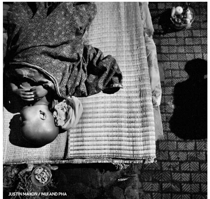
JUSTIN MAXON / MUI AND PHA