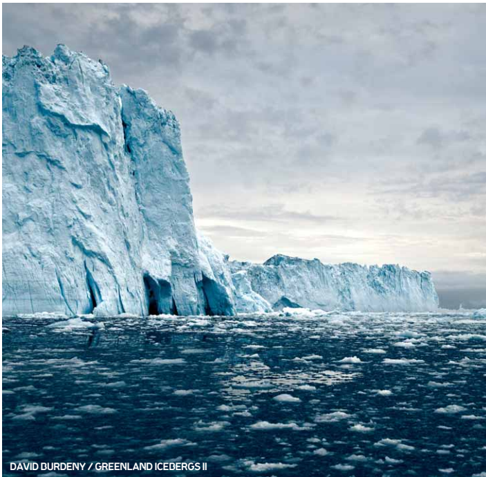
DAVID DURDENY / GREENLAND ICEBERGS II