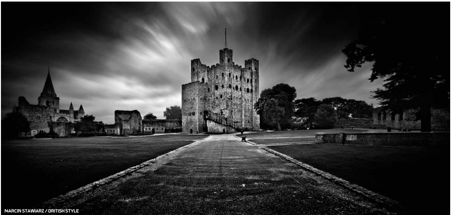
MARCIN STAWIARZ / BRITISH STYLE