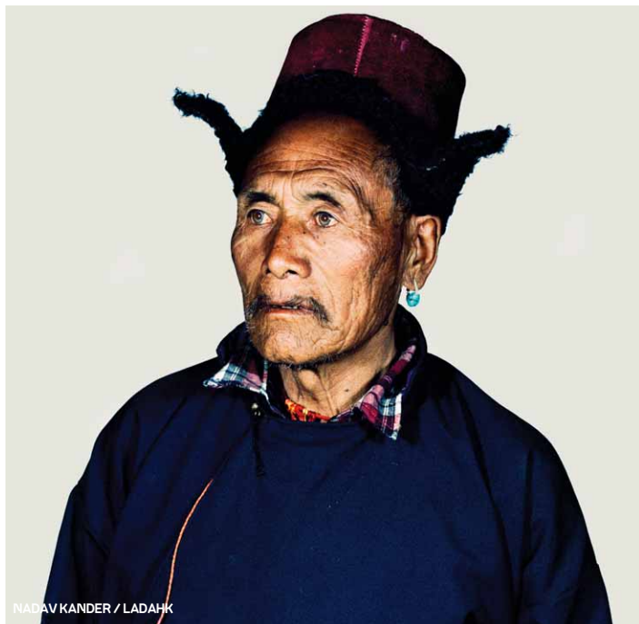
NADAV KANDER / LADAKH